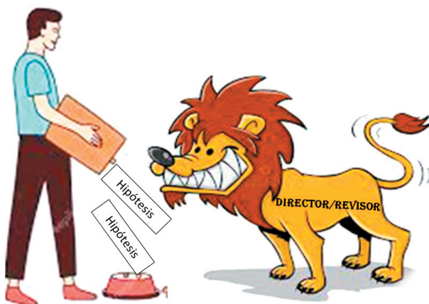
Figura 1. Ilustración metafórica de la exigencia, a veces injustificada, de incluir hipótesis en los proyectos de investigación en ecología. Este accionar muchas veces genera la inclusión de hipótesis inadecuadas que oscurecen el objetivo del trabajo, son lógicamente inviables de poner a prueba, determinan un diseño incorrecto, dificultan el desarrollo y la escritura del trabajo y generan un síndrome auto-inmune de rechazo al proyecto por parte del autor.

Incluir hipótesis cuando el estudio no lo requiere es una práctica tan nociva como no hacerlo cuando el estudio lo requiere. Como se discutió anteriormente, ciertos tipos de investigación no necesitan la formulación de hipótesis porque no ponen a prueba ideas ni intentan explicar la causa de un patrón. En